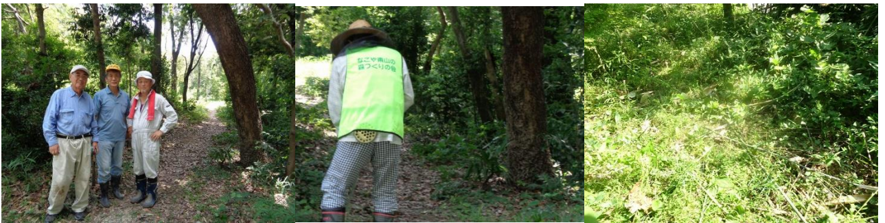
7月14日 藤巻班活動日