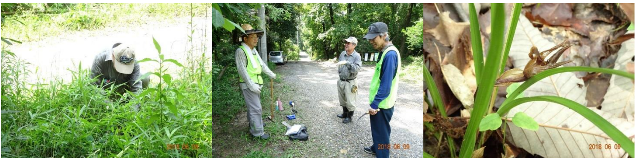
6月9日 藤巻班活動日