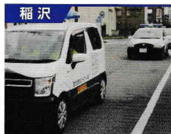
西光坊防犯パトロール隊

隊員176名です。 小学生児童の下校時の見守りや、夜間の巡回パトロールをしています。 6月1日に、警察署長や小学校長の出席の下、隊員等120名が参加して結成式を行いました。