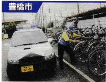
豊橋市 大清水校区地域安全パトロール隊

会員88名です。登下校時の見守り活動、家屋の防犯診断、防犯教室を主催する他、昨年8月に青パト車を導入したことで、青パトによる「見せる防犯」が犯罪抑止に効果を発揮しています。