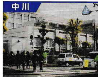
中川区五反田学区防犯パトロール隊

区政協力委員、老人会、女性会、PTA等総員78名です。 月～金曜日までの毎日2回の巡回パトロールを行い、夏休み・年末には学区民と警察の合同パトロールを実施しています。