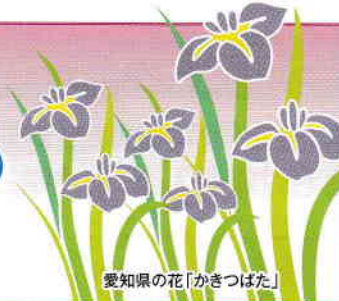
愛知の花「かきつばた」

発行所：(公社)愛知県防犯協会連合会 名古屋市昭和区円上町26番15号 愛知県高辻センター 2階 (052)871-2110