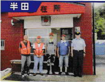
半田 パトロール日間賀

日間賀島の青パト隊で、隊員30名です。島民と観光客の安全安心のため、駐在さん達と一緒にパトロールを行っています。写真は、駐在所から、駐在さん、役場職員と共にパトロールに出発するところです。