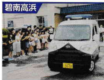
碧南高浜 特定非営利活動法人高浜南部まちづくり協議会

会員14名です。旭東小学校地区で、児童の登下校時間帯を中心に、徒歩や青パトによる防犯パトロールを行っています。8月1日に、知多市の緑広場に市内の青パト隊が集合して、出発式を行いました。