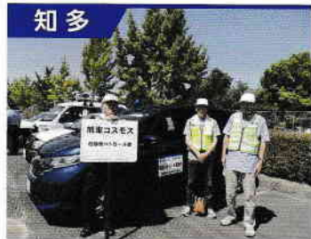
知多 旭東コスモス自動車パトロール隊

日間賀島の青パト隊で、隊員30名です。島民と観光客の安全安心のため、駐在さん達と一緒にパトロールを行っています。写真は、駐在所から、駐在さん、役場職員と共にパトロールに出発するところです。