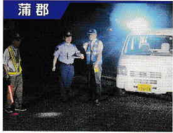
蒲郡 形原6区愛のパトロール隊

隊員13名です。青パトでの巡回パトロールや児童の登下校時の見守り活動を行い、今後は防犯少年団員の委嘱を受けた黄柳川小学校児童とともに、パトロールや防犯キャンペーンを実施する予定です。