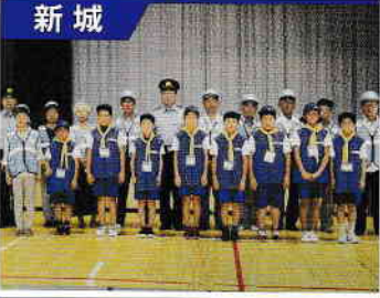
新城 山吉田青パト隊

会員は約200名です。現在14台の青パト車両有り、毎日2台が稼働して登下校時の見守り活動を行い、年に数回は14台全車一斉パトロールや、夏・冬休みの終業日に、青パト車先導による「一斉下校の会」を実施しています。