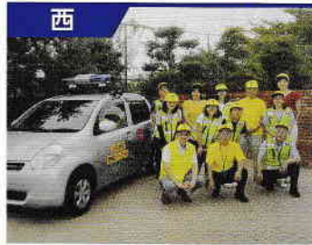
山田学区防犯パトロール隊

その活動は、地域住民の安心感と連帯意識を強化し、不審者を寄せつけなくすることで地域防犯力の要としての役割を担っています。