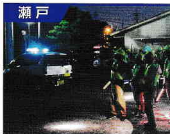
長根連区連合自治会青パト隊

隊員は90名です。 「自分たちの街は自分達で守ろう」を基本理念に、夜間パトロールを始め、児童の登下校時の見守り活動や学校行事、学区の祭りやイベントの警備等、犯罪抑止に積極的に取り組んでいます。