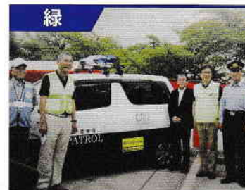
戸笠学区連絡協議会防犯パトロール隊

隊員は18名です。 小中学校生徒の登下校時の青パト巡回を始め、ゼロの日や夜間の全各町内会パトロールにも参加したり、防犯灯の点検も行い、明るく住みやすい街づくりを目指しています。