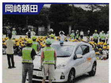
岡崎額田 細川学区防犯パトロール隊

会員108名です。児童の登下校時の見守りとパトロールの他、週3回の夜間巡回パトロールを行っています。本年6月に、高浜市立港小学校で、日本財団の助成を受けた青パト車両の出発式を行いました。