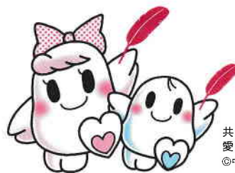
共同募金キャラクター 愛ちゃんと希望くん ©中央共同募金会

共同募金会は税制上、国と地方公共団体と同じように、寄付に対する『優遇措置の対象団体』になっています。税制上の優遇措置が講じられているのは、共同募金会の行う事業が社会福祉法によって位置づけられた運動であり共同募金による配分が社会福祉の増進に貢献していると社会的評価を得ているためです。