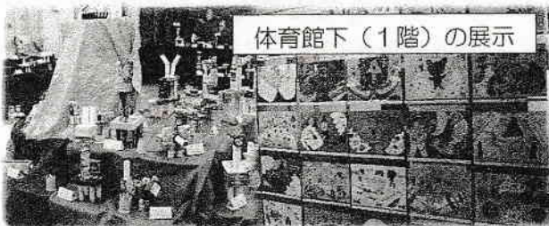
体育館下(1階)の展示