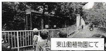
東山動植物園にて

1年生と6年生、2年生と4年生、3年生と5年生がペアとなり、東山動植物園や牧野ヶ池緑地に遠足に出掛けました。クイズラリーをしたり、一緒に遊んだりして交流を深めました。