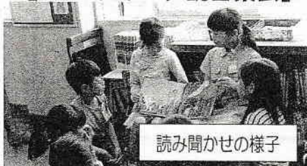
読み聞かせの様子

学校開放日の2時間目は、全校ペア読書集会を行いました。高学年の読み聞かせや、低学年の音読発表など、どの学年の子ども、練習の成果を発揮して、上手に本を読むことができました。