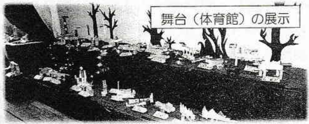
舞台(体育館)の展示