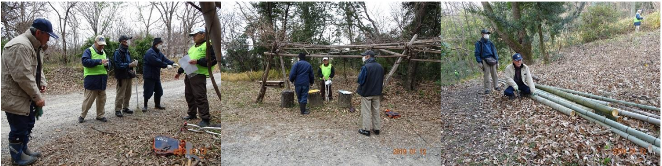
1月12日藤巻班活動日