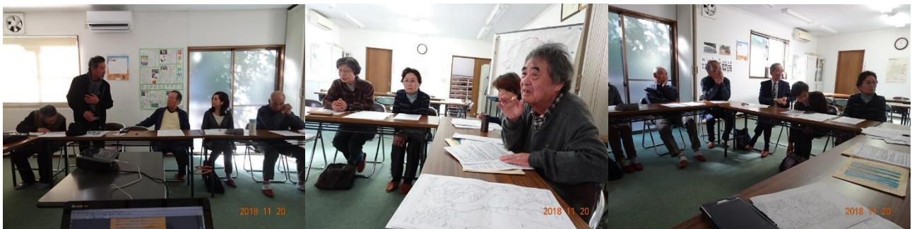
11月20日新池周辺住民による「具体的な活動方針についての検討会」