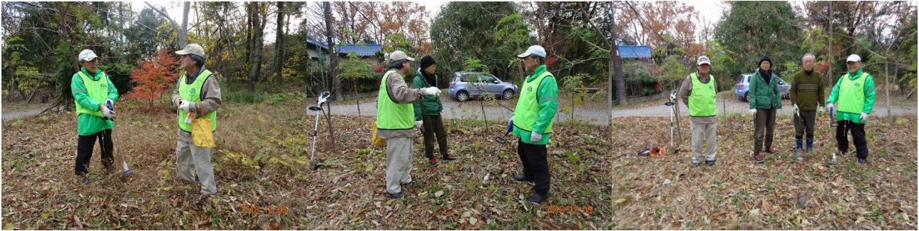
12月8日藤巻班活動日