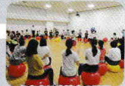
ふれあい交流会の開催