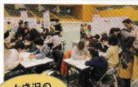
大盛況の体験コーナー