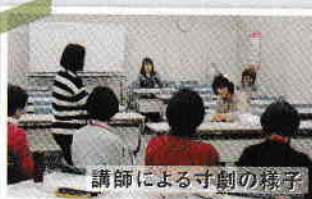
講師による寸劇の様子

修了者の方には今後は生活支援の担い手やそれぞれの地域で地域活動やボランティア活動などできる範囲で関わっていただけることを願っています。