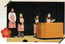
ボランティア団体の活動紹介