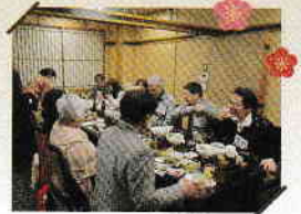
区民交流還暦パーティーの様子