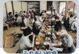
ふれあい給食サービスの実施