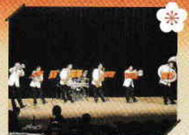
愛知東邦大学吹奏楽団による記念演奏

式典の終了後には、「区民交流還暦パーティー」も開かれ、中学校のクラスメイトとの再会などもあり、とても盛り上がりました。