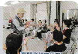
高齢者はつらつ長寿推進事業の実施