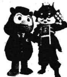
コノハけいぶ めいとう勝家くん