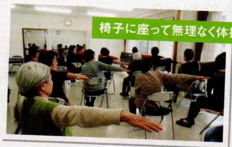
椅子に座って無理なく体操