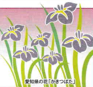
愛知県の花「かきつばた」

発行所：(公社)愛知県防犯協会連合会 名古屋市昭和区円上町26番15号 愛知県高辻センター 2階 (052)871-2110