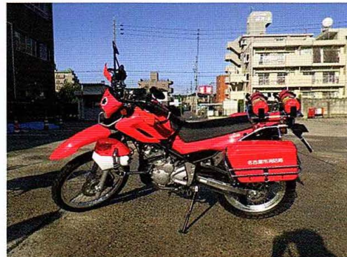
バイク（赤鯨：あかしゃち）などの展示