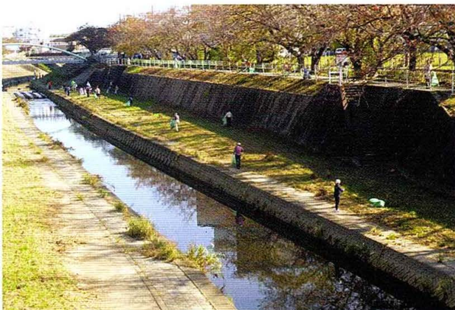
香流川クリーン大作戦

香流川の河川敷や堤防道路などを清掃します。 日時 10月27日（日）午前9時から 場所 新屋敷橋から藤森橋までの緑道及び河川敷