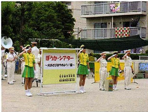
ポッカレモン市消防音楽隊