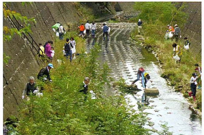
植田川クリーン活動

香流川の河川敷や堤防道路などを清掃します。 日時 10月27日（日）午前9時から 場所 新屋敷橋から藤森橋までの緑道及び河川敷