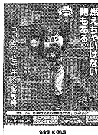
< B 2 サイズポスター >