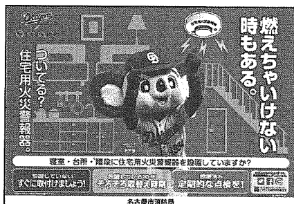
< B 3 サイズポスター >