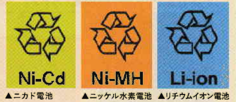
▲ニカド電池 ▲ニッケル水素電池 ▲リチウムイオン電池

ニカド電池、ニッケル水素電池、リチウムイオン電池で、右記のようなマーク(スリーアローマーク)がついているものが対象です。