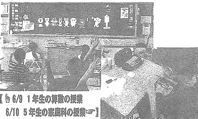
【6/9 1年生の算数の授業】