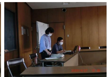
9月27日 西山水処理センターでの藤巻町勉強会