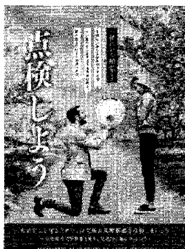
<B2・B3・A3 サイズポスター>