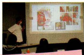
子ども食堂の報告や...

去る4月24日(土)には、昨年度助成を受けた団体による「事業報告会」を開催しました。どの団体にも共通してコロナ禍での活動は困難を極めたようですが、それでも試行錯誤して事業実施に至った経緯など、熱く報告しておられました。感染対策も万全に整え実施された事業は、どれも子どもや子育て中の方々に「応援したい!」気持ちで詰まった素敵な事業でした。