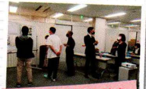
互いに情報交換もできました。