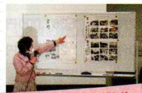
地域の協力を得るまでの話など...