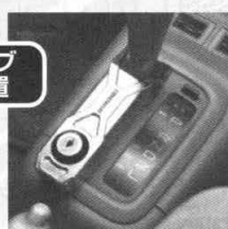
シフトノブ 固定装置