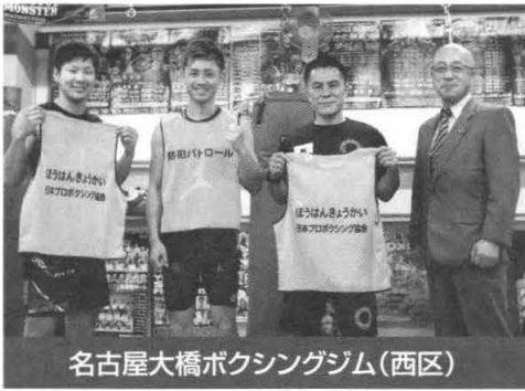
名古屋大橋ボクシングジム(西区)