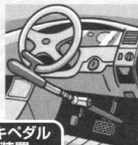
ブレーキペダル 固定装置