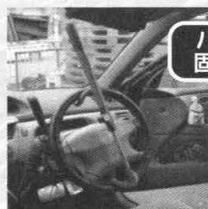
ハンドル 固定装置