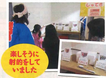
楽しそうに射的をしていました