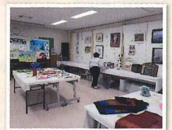
▲コミセンまつり(昨年度の様子)▲

地域の皆様の共同募金により、地域行事としてコロナ禍にありながらコミセンまつり(作品展)を開催し、住民同士の交流を図ることができました。ありがとうございました。