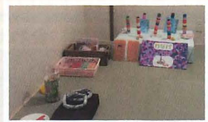
▲昔懐かしの輪投げ