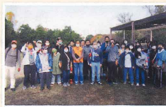
▲知的障害児交流体験事業 (昨年度の様子)

牧野ヶ池緑地芝生広場を親子で1~3周しました。チェックポイントごとにお菓子、1周するごとに景品が貰え、楽しく過ごすことができました。なかなか外出もできず本人も親もストレスの溜まる中、久しぶりに行事をすることができ、とても楽しそうな笑顔も見ることができました。本当にありがとうございました。