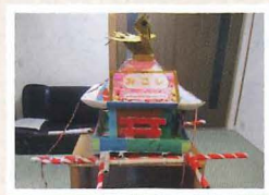
▲作業所の利用者さん手作りの“おみこし”