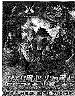
< B 2 サイズポスター >