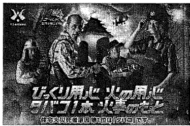
< B 3 サイズポスター >