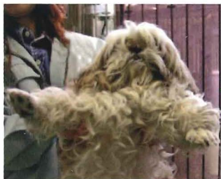
(動物愛護センターに収容直後)