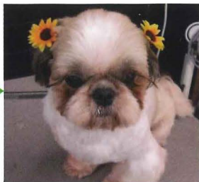
キレイに可愛くしてもらったよ