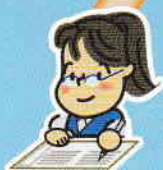
主任介護支援専門員