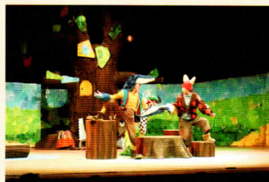
ウェルカム名東転入者応援事業