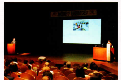
地域包括ケア区民のつどい