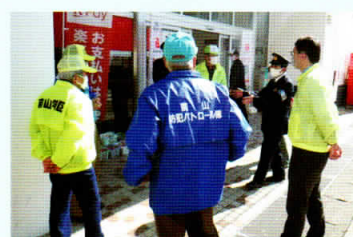
名東区防犯の日キャンペーン