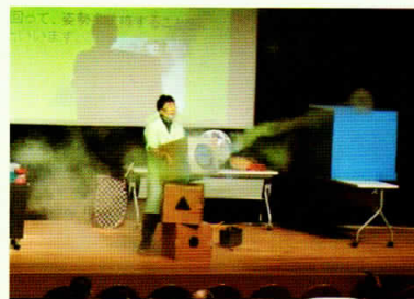
エコアクションin名東