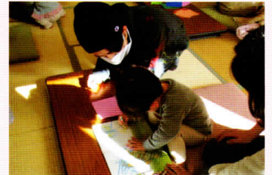
絵本でつながる親子の時間