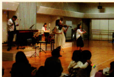
わがまち名東フェスティバルファミリーコンサート