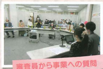
審査員から事業への質問