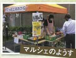
マルシェのようす

虹ヶ丘介護老人保健施設の駐車場で開催していた、すてっぷ工房『あかね』さんが運営するマルシェです。小さい場所ながら、野菜と事業所の製品が並んでいました。事業所の活動の一つで農作業を取り入れられ、夏のマルシェには育てたキュウリなど作物が並ぶそうです。