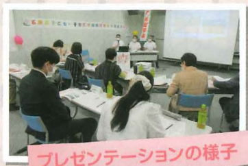
プレゼンテーションの様子

6月18日(土)に実施した審査会では、応募したそれぞれの団体が決められた持ち時間の中で、子どもや子育て中の親をターゲットとした企画のプレゼンテーションを行い、事業の必要性などを訴えておられました。どの企画も「身近にあるとうれしい」と思う事業で、今後の展開が楽しみな内容でした。