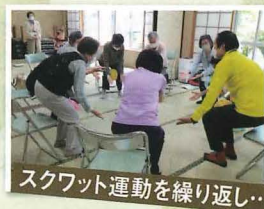
スクワット運動を繰り返す...