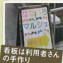
看板は利用者さんの手作り

事業所の利用者の方も店頭にたち、スタッフは「私たちのことを知ってもらいたい。そのための活動です。」とお話されていました。