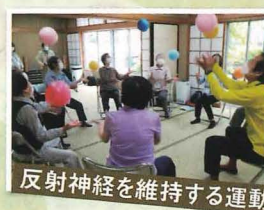
反射神経を維持する運動

「体力の衰えは足からきます」と、運営者ご本人の経験から健康づくりのサロンを立ち上げられ、8年になるサロンです。開設当初からの参加者は「健康を維持してこられています。」とのこと。「お嫁さんに勧められて…」と参加された1年目の方も、「運動は適度で脳トレもあり、無理なくとても楽しく参加しています。」と、充実した時間を過ごされていました。