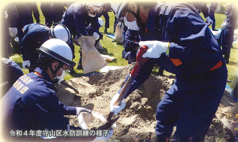
令和4年度守山区水防訓練の様子

災害対策委員 News とは 市の防災対策に関して、地域と本市との橋渡し役をお願いしている災害対策委員（区政協力委員が兼務）の皆様、防災に関する情報をこの News で定期的にお届けいたします。