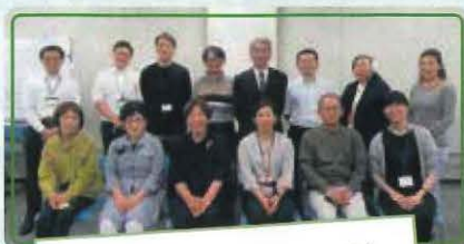
「みんなを支えあえるネットワーク」 第2ワーキンググループ