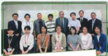
「みんなが活躍できる」 第1ワーキンググループ