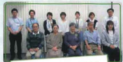
「みんなですべてを育むまち」 第3ワーキンググループ