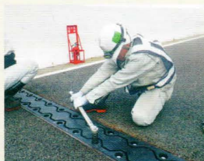
伸縮装置の取り替え

高機能舗装への打ち換えや、施設等の補修工事を行います。併せて大規模修繕工事(防水層の設置)を行い、構造物の長寿命化を図ります。