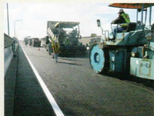
高機能舗装への打ち換え

安全・安心・快適な道路サービスを提供できるよう、リフレッシュ工事を行います。交通規制が必要な作業を集約し、9日間の通行止めを実施します。