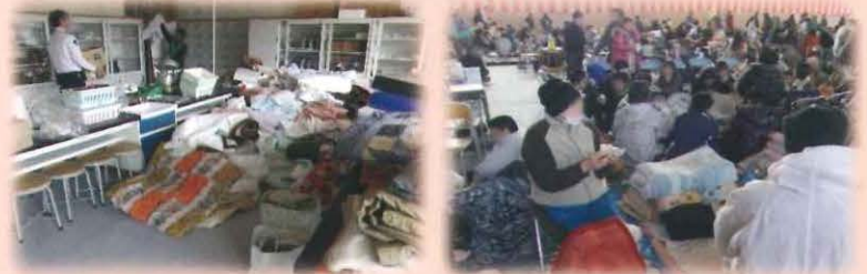
【東日本大震災当時の陸前高田市の避難所の様子】

指定避難運営の基本的な考え方は、避難者による「 自主運営 」となります。災害の備えとして市公式ウェブサイトや指定避難所に設置してある「指定避難所マニュアル」を確認しましょう。