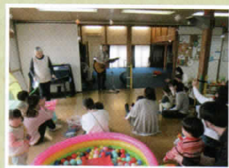
歌の時間は牧師さんがギターを演奏してくださいます。歌に合わせて子どもたちも手をたたいたりとはしゃいでいます♪

暖かいスタッフと沢山の友達、自由にはしゃげる空間の揃った魅力的なサロンでした!気になる方はぜひお立ち寄りください♪