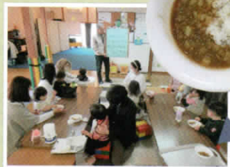
お昼にはカレーをいただきました。赤ちゃん用のものもあり、どの子どももばくばくおいしそうに食べています。おかわりをする子も!