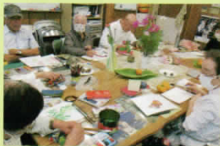
▲題材の乗った大きなテーブルをみんなで囲みます

続々といらっしゃる参加者に、代表の方が明るく声を掛けます。今日描きたい題材(お花や小物)を参加者で持ち寄り、画用紙や絵の具等準備ができた方から絵を描いたり、ぬりえをされている方も。絵を描きながら、題材の話や世間話・昔話等、好きなタイミングでお話ができます。おしゃべりを楽しむもよし、黙々と絵に没頭するのもよし! 参加者からは、「月1回なので楽しみで無理なく来られる。」「ホッとしに来ています。」との感想をお聞きました。暖かみのある芸術と、にぎやかな会話あふれるサロンでした。