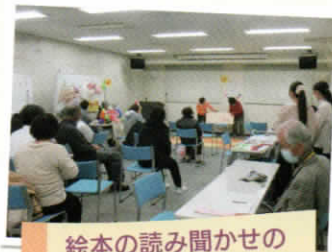
絵本の読み聞かせの 様子です♪