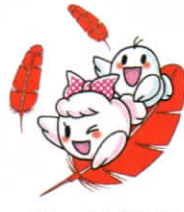
愛ちゃんと希望くん