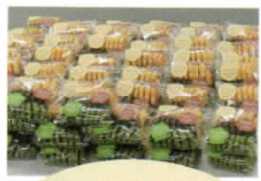
ひまわり福祉会 「ひとくちクッキー」 をおみやげに