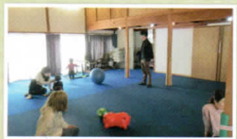
広いスペースで元気に走り回る子どもたち。柱には角を保護する対策がしてあり、安全への配慮が感じられます!

教会の集会場に子どもたちの元気な声や、お母さんお父さん方のにぎやかな話声が響きます。今回は教会で開かれている子育てサロン『こどもひろば』に伺いました。