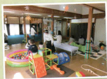
寄附等で集まった遊具や おもちゃたちやお友達のいる空間で 子どもたちの遊びの幅が広がります♪

内容 おもちゃ・遊具のある広いスペースで 自由にお過ごしいただけます 歌や手遊び、時には紙芝居や 読み聞かせもあります