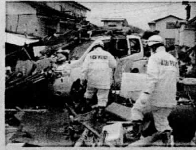
東日本大震災の被害状況

死者(災害関連死を含む) 19,765名 行方不明者 2,553名【R5.3.1時点】