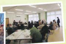
▲演奏に合わせて口ずさみます♪