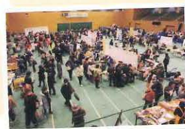
↑めいとう福祉まつり