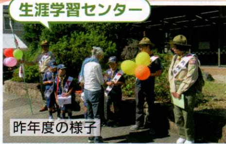
生涯学習センター

10月1日から 赤い羽根共同募金 運動が始まります。 今年もみなさまからの あたたかいご協力をお 願いいたします。