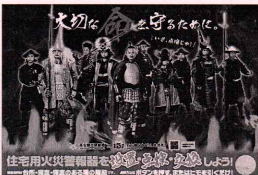
<B3・A3 サイズポスター>