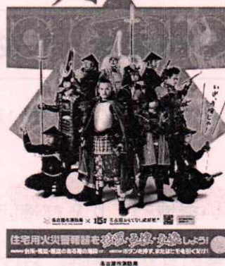
<B2・B3・A3 サイズポスター>