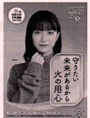
<B2・B3 サイズポスター>