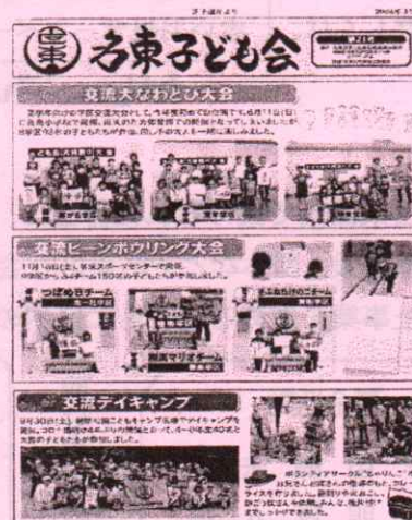
名東区子ども会育成連絡協議会 子ども会広報誌作成事業