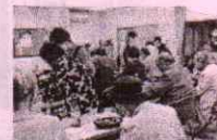
ふれあい給食サービス事業

県内の福祉推進のために 3,241,000円(30%) ○社会福祉施設の整備費 ○社会福祉団体の事業費 など