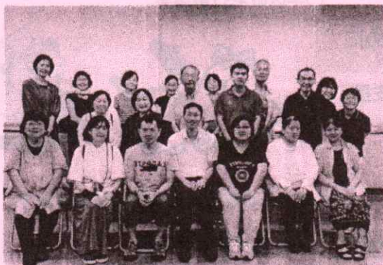
名東区身体障害者福祉協会 身体障害者福祉推進のための研修事業

皆様から寄せられた共同募金を使用させていただき、聴覚障害当事者の体験について講演会を開催することが出来ました。ありがとうございます。