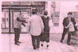
児童虐待防止キャンペーン

子どもたちのために 2,339,000円(21%) ○子ども会活動支援 ○保育園備品整備事業 ○子育て支援活動事業