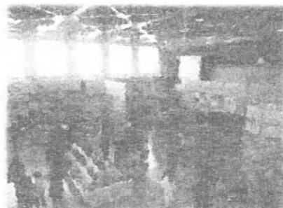
体育館の展示の様子