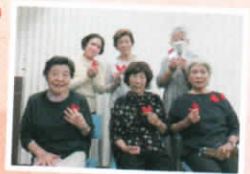
▲もみじの会のみなさん

街頭募金で、通常は募金にご協力いただいた方へ赤い羽根と絆創膏をお渡ししています。今年、ボランティア団体さんのご協力でも糸で編んだ赤い羽根とハートモチーフの2種類が加わり大人気でした。作成いただいた「もみじの会」の皆様、本当にありがとうございました!