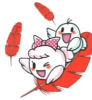
愛ちゃんと希望くん